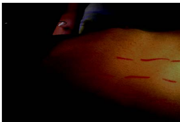
Fig.1. Distancia entre las líneas axilar anterior y posterior de aproximadamente 8 cm.

A continuación se aprecian en las Figura 1, Figura 2, Figura 3 y Figura 4 algunos de los pasos del proceso quirúrgico, como muestra de las imágenes contenidas en el folleto: