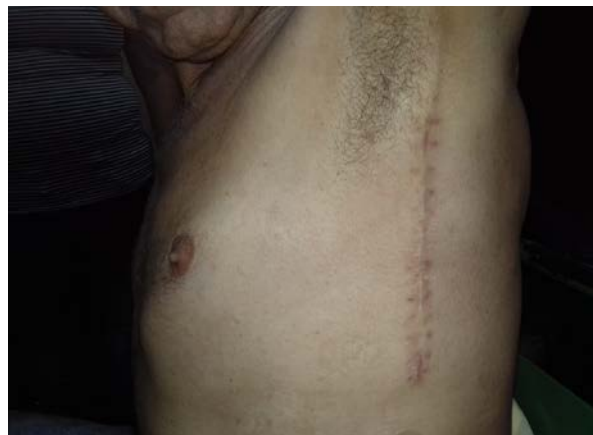
Fig.4. Cicatriz a 40 días del posoperatorio.

En la literatura médica, varios autores han confeccionado manuales o folletos para fortalecer la enseñanza en cirugía torácica, entre ellos Hurtado Hoyo (3) en el año 1976, autor ya mencionado en este artículo; y otros como De La Torre Bravos et al., (12) quienes en su obra aportan información completa y clara sobre las diferentes urgencias torácicas que puede encontrar el médico en el ejercicio de su trabajo, desde las intraoperatorias y