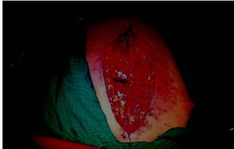
Fig.3. Después de retirados los separadores.