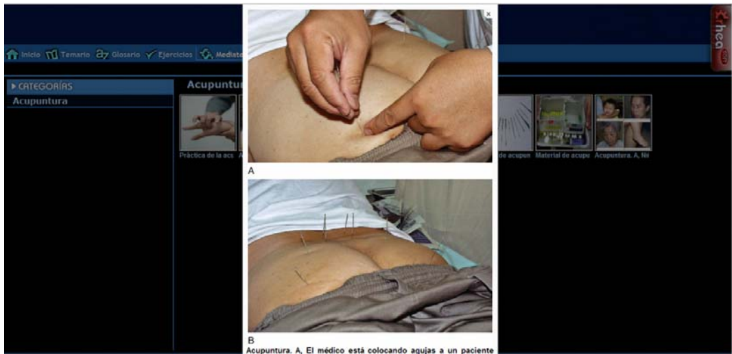
Fig. 4. Módulo Mediateca.

Valoración teórica del producto a través del criterio de expertos: emitieron en su mayoría criterios de Muy Adecuado respecto a los diferentes aspectos que conforman el software. Los detalles de estos resultados se aprecian en la tabla, donde se constata que el 62,5 % coincidieron en la capacidad del producto para satisfacer necesidades de aprendizaje y en su aplicabilidad; el 87,5 % afirmaron que representa un modelo didáctico de alta pertinencia e impacto para la educación y el 100 % coincidieron en que el software tiene potencialidades para ser generalizado en la docencia.