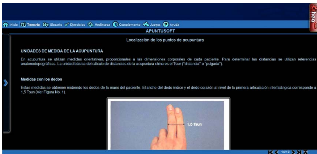
Fig. 1. Módulo Temario. (Localización de los puntos).

En el módulo Temario se ofrecen generalidades y conceptos sobre la MNT que debe conocer el estudiante desde su primer año de la carrera para aplicarlos posteriormente en la práctica tradicional. En el acápite Acupuntura se exponen aspectos de la localización de los puntos: cómo localizarlos, cuáles son las principales unidades de medidas, según se observa en la figura 1; y los principales puntos que compete conocer el estudiante de Medicina por su efecto en los diferentes sistemas y órganos que aborda la Morfofisiología (sistema osteomioarticular, endocrino, reproductor, urinario, cardiovascular, respiratorio, digestivo y nervioso), todo esto acompañado de las pertinentes imágenes, lo cual se ilustra en la figura 2.