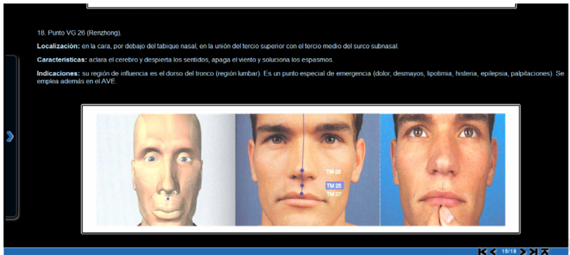
Fig. 2. Módulo Temario. (Sistema de los 18 puntos).

En el módulo Glosario se ofrecen términos relacionados con la acupuntura en español e inglés; y en el de Ejercicios se ofrece un sistema de preguntas tipo test sobre la localización de los puntos de acupuntura anatómicamente y sus principales efectos, según se aprecia en la figura 3.