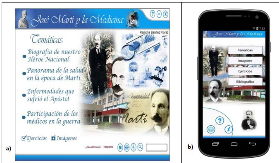
Fig1. Página Principal: a) versión para las PCs y los dispositivos iOS. b) Sistema Android

Pantallas identificación y registro: El producto contiene un registro en el que se insertan los nombre(s) y apellidos de los estudiantes y el grupo al que se pertenecen, seleccionando la opción guardar y los datos quedarán almacenados en la aplicación. Se pueden registrar la identificación y los puntos obtenidos en los ejercicios en la base de datos del software.